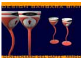
Progetto Caffè Mingo